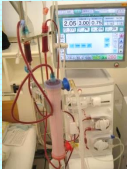
人工透析装置 (血液浄化業務)