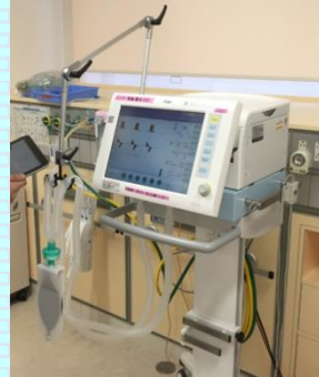
人工呼吸器 (呼吸治療業務)