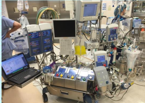
人工心肺装置 (手術室業務)