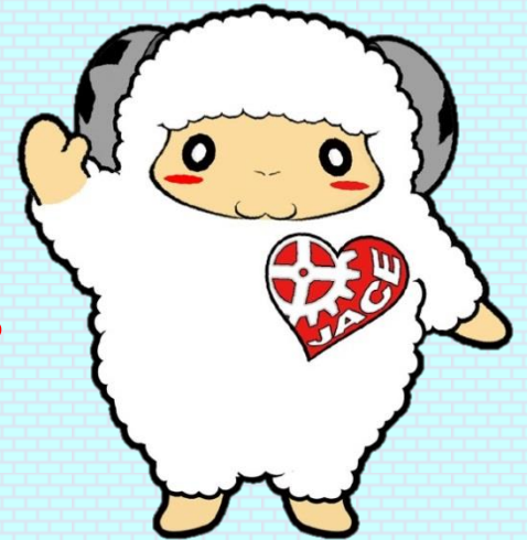
日本臨床工学技士会マスコットキャラクター 『シープリン』